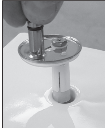
02: Monter beslagene i kummens huller