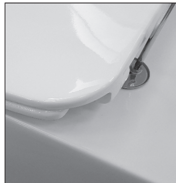
05: Spænd nu skruerne stramt.