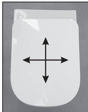
04: Skyd sædet på plads, før skruerne spændes