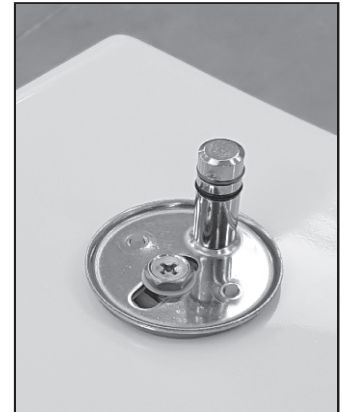
03: Spænd skruerne løst. Beslaget skal kunne bevæge sig.