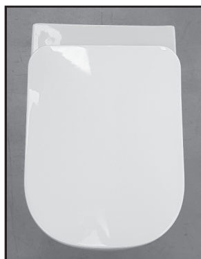
09: Færdig monteret toiletsæde

OBS: Korrekt montering af Quick Release beslagsæt.